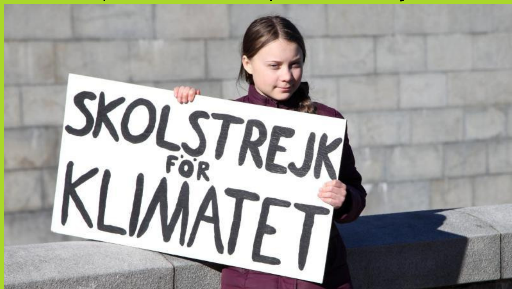
Greta Thunberg, impulsora del moviment

Acció social per conscienciar a la població de la urgència climàtica